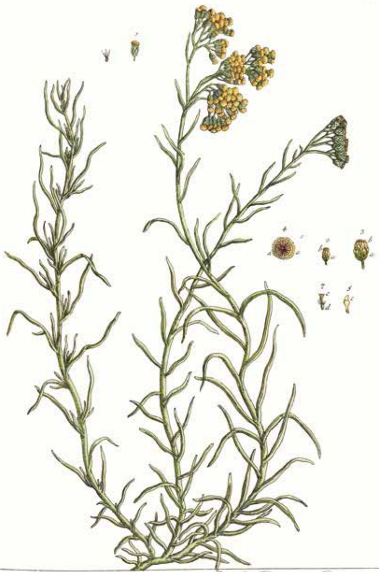
Steccas citrina. { 1-5. Blüthe 6. 7. Saame } Rhein-Blume.