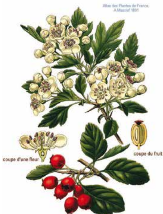
Pl. 110. Subépine épineuse . Crataegus Oxyacantha L.

Preparati od gloga se ne preporučuju tijekom trudnoće niti dojenja.